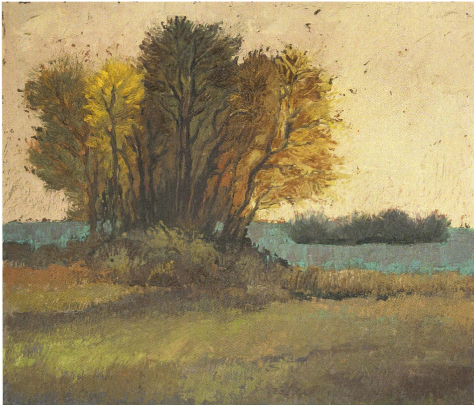
Babelsberger Park 3“, 1997